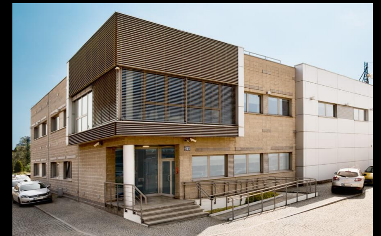
Centrum Danych w Krakowie – ul. Albatrosów 16B