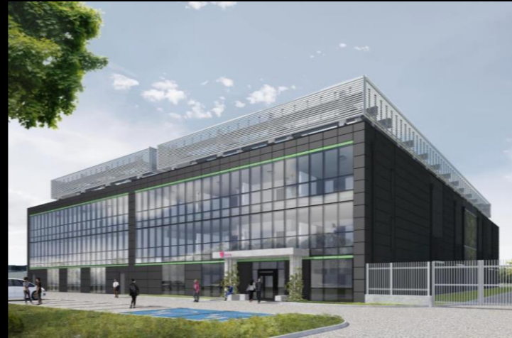
Centrum Danych w Warszawie – Ul. Szlachecka 49