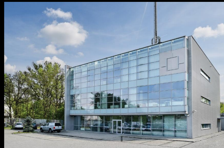
Centrum Danych we Wrocławiu – ul. Na Ostatnim Groszu 116