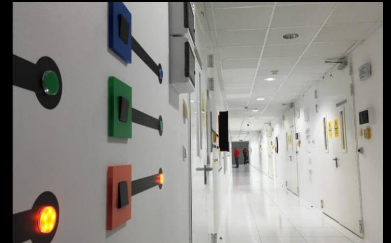
Centrum Danych w Piasecznie – ul. Jana Pawła II 66